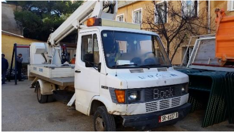
APV Mercedes benz tip kosh 408D me targa SR6137B viti 1991 shasia WD86113181P152749