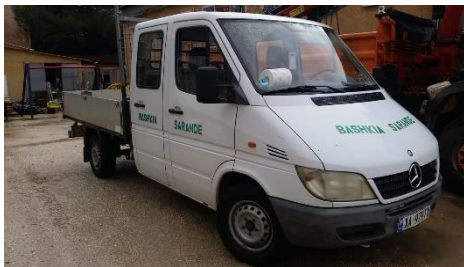
ATP Daimler Chrysler 311CDI Sprinter me targa AA979TX viti 2001 shasia WDB9036221R315902