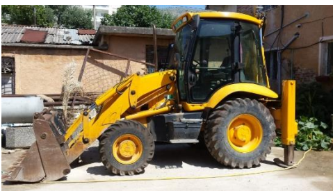
JCB 3cx Skrep me targa AGMT66 viti 2003 shasia SLP3CXTS3E09376681

Ndermarrja jone, zoteron keto automjete , që do të mirembahen dhe shërbehen sipas kesaj kontrate: