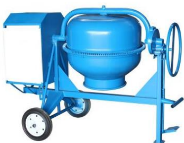
Betoniere ndertimi, 180 Lt, motorr 6.5 HP

Mjetet qe zoteron Ndermarrja jone dhe qe do te mirembahen sipas kesaj nee vend jane: