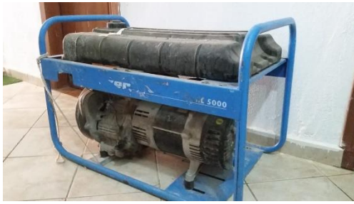
Gjenerator rryme : tip “BLIZZER” me benzene BL 5000.