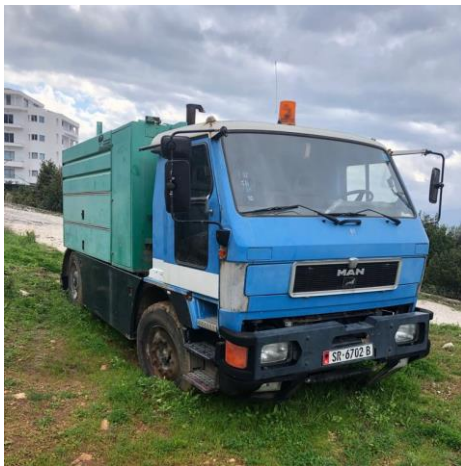
APV MAN Autobot E49 me targa SR6702B viti 1996 shasia WMAE490063L012351