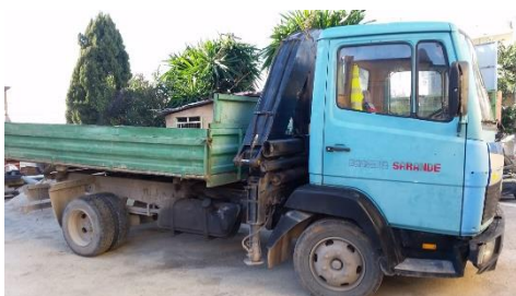
Daimler Benz 814 kamion me targa AA695FR viti 1986 shasia WDB67401215266219