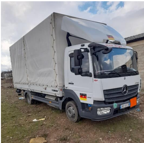
Automjet per transport mallrash me mbulese Mercedes Benz Atego me targa AB047DB viti 2017 shasia WDB96702110121010

Mjetet qe zoteron Ndermarrja jone dhe qe do te mirembahen sipas kesaj nee vend jane: