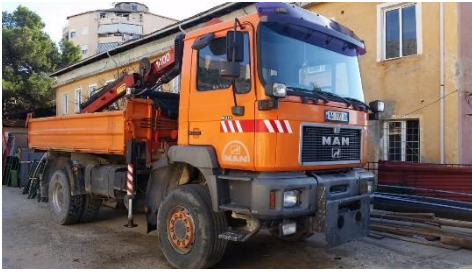
MAN kamion me vinç me targa AA792UG viti 2000 shasia WMAT34ZZZ1M308039